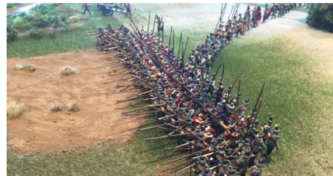
Diorama zur entscheidenden Phase der Schlacht.