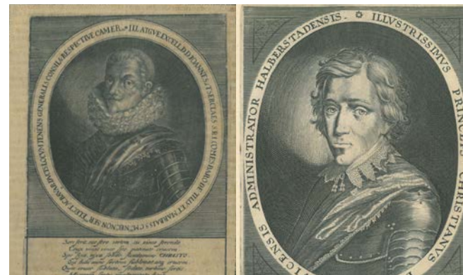
Wissenswertes und Persönliches Johann T. Serclaes Graf von Tilly und Herzog Christian von Braunschweig