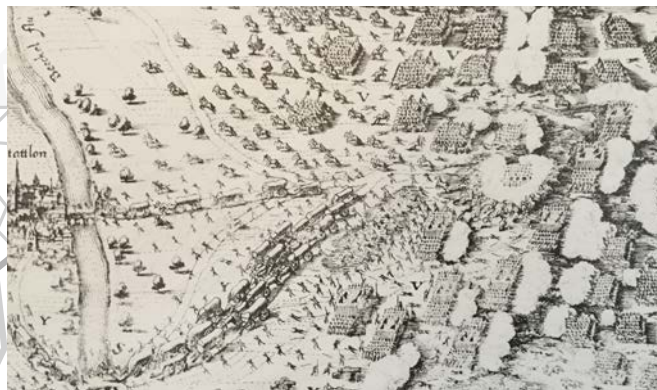
Bilder, Dokumente und Filme zum 30-jährigen Krieg und zur Schlacht bei Stadtlohn.