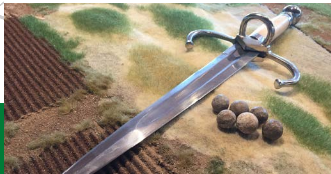
Waffen, Munition und Schlachtfeldfunde von der Schlacht bei Stadtlohn und dem 30-jährigen Krieg.